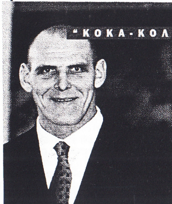
Rysslands yngste general

OS-framgångarna betyder inte bara mycket sportsligt utan även, vilket är minst lika viktigt, när det gäller att skaffa sponsorer.