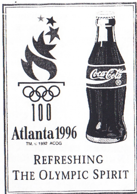
Kanske skulle Atlantas logotype ha sett ut så här

Den överdrivna kommersialiseringen gav sponsorererna mer badwill än goodwill och fick till följd att konsumenterna nästan kände avsky mot all kommers. Ledande sportanalytiker rekommenderar därför helt andra typer av sponsringavtal inför Vinter OS i Nagano 1998, Fotbolls VM i Frankrike och Sommar OS i Sydney 2000. Att låta mindre företag sponsra tävlingarna och att arrangörerna har kontroll över sponsorkaktiviteterna ser analytikerna som en motvikt mot kommersiella överdrifter. det är inte meningen att OS och VM-tävlingar skall se ut som en kommersiell marknadsplats, vilket dessvärre OS i Atlanta gav prov på säger analytikerna.