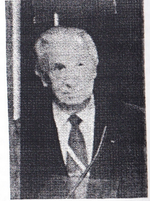
Juan Antonio Samaranch