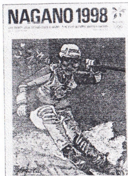
En av sju officiella OS-affischer.

Sju olika affischer, designade av den japanske konstnären Koji Kinutani har avtäckts i OS-staden Nagano. De sju affischerna föreställer skidåkare, bobåkare, skidskyttar, utörsåkare, ishockeyspelare, konståkare och curlingspelare i full aktion. På affischerna finns också en slogan på japanska som översatt till engelska lyder: Let's go. Fight.