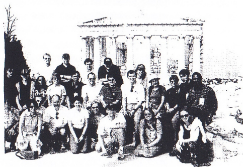
1999 ARS DELTAGARE