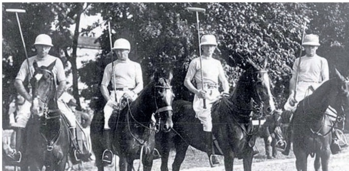
Ready to play! Hästpolo var en av många sporter med brittisk anknytning.