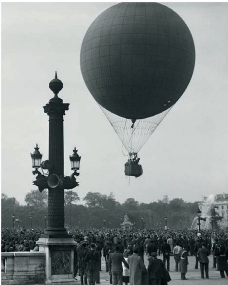
Stort intresse när ballongerna gav sig iväg.

Och det verkar ha gällt för flera av deltagarna. För den som kan franska är den officiella OS-rapporten uppenbarligen en spännande läsning. Här berättas om oväder, farter på