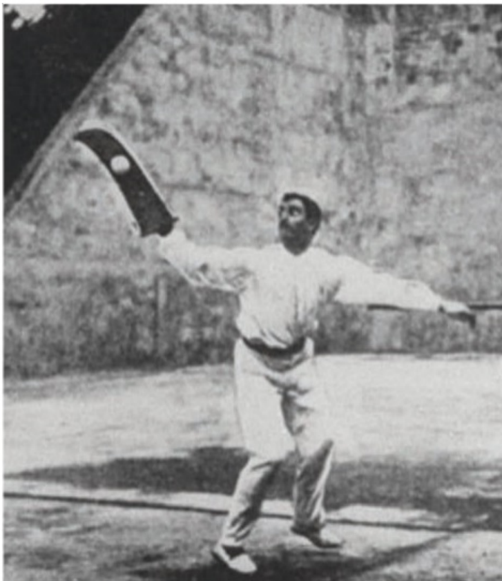
Pelota med racketvarianten cesta.

Olika klasser utkämpades, dels en med så kallad Lyonboll och en annan med den parisiska bollen (ibland kallad bankspel). Ett lag från Lyon vann föga överraskande med Lyonbollen.