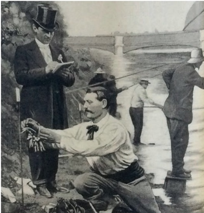
Metarna från hemmanationen satsade på mängd, amerikanerna på att fånga