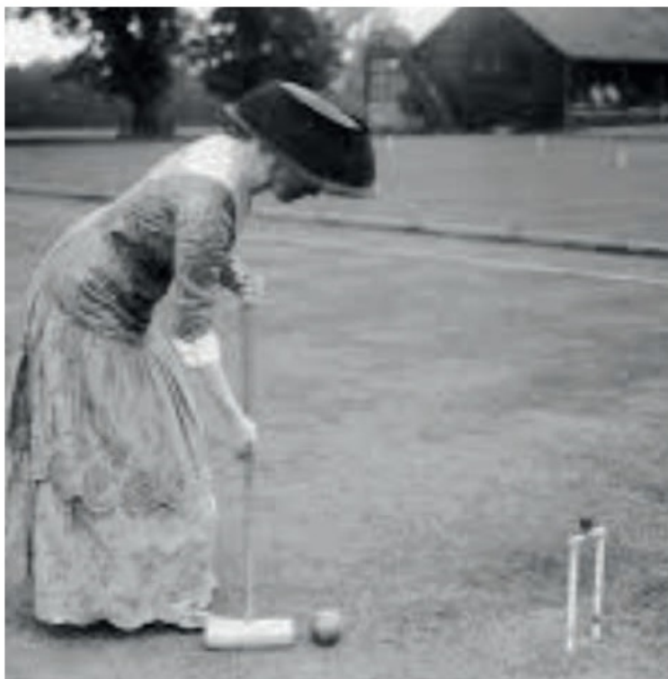
I krocket tilläts även kvinnor att vara med.