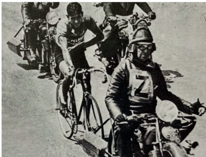
Exempel på pacning från en tävling 1937.