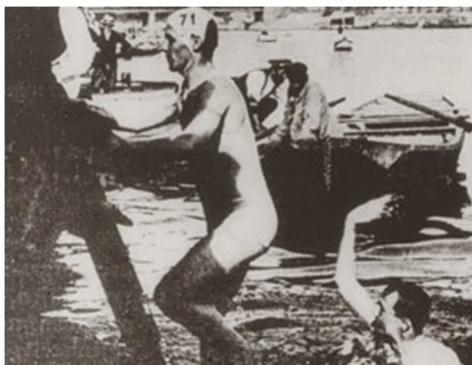
Upp, ned och under, en tävling som gjord för "Mästarnas mästare".

EN TÄVLING som borde passa i tv-programmet "Mästarnas mästare". Det började med att deltagarna fick klättra upp på en fem meter hög påle. Därefter glida ner i vattnet igen. Efter 100 meters simning väntade första hindret: ett antal roddbåtar, som skulle bordas och springas över. Ner i vattnet igen, och nya båtar i vägen. Nu skulle dessa passeras