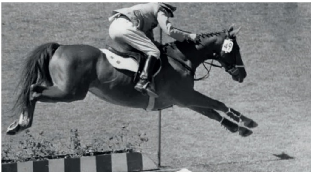
Hästen Extra-Dry levde upp till sitt namn och var torr om hovarna. Vann med längsta språnget.